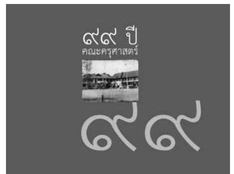
▶ รูปแบบหน้าปกหนังสือและรูปเล่มที่ระลึก 99 ปี คณะครุศาสตร์ ออกแบบโดย สาขาวิชาศิลปกรรมศึกษา

สำหรับรายได้จากการจำหน่ายเหรียญที่ระลึก 99 ปี หลังหักค่าใช้จ่าย พร้อมเหรียญสมเด็จเจ้าพระยาบรมมหาศรีสุริยวงศ์ (ช่วง บุนนาค) เนื้อทอง และหนังสือที่ระลึก 99 ปี ทางคณะครุศาสตร์ จะทูลเกล้าฯ ถวายสมเด็จเจ้าพระยารัตนราชสุตยาฯ สยามบรมราชกุมารี โดยเสด็จพระราชกุศลตามพระราชอัธยาศัย •