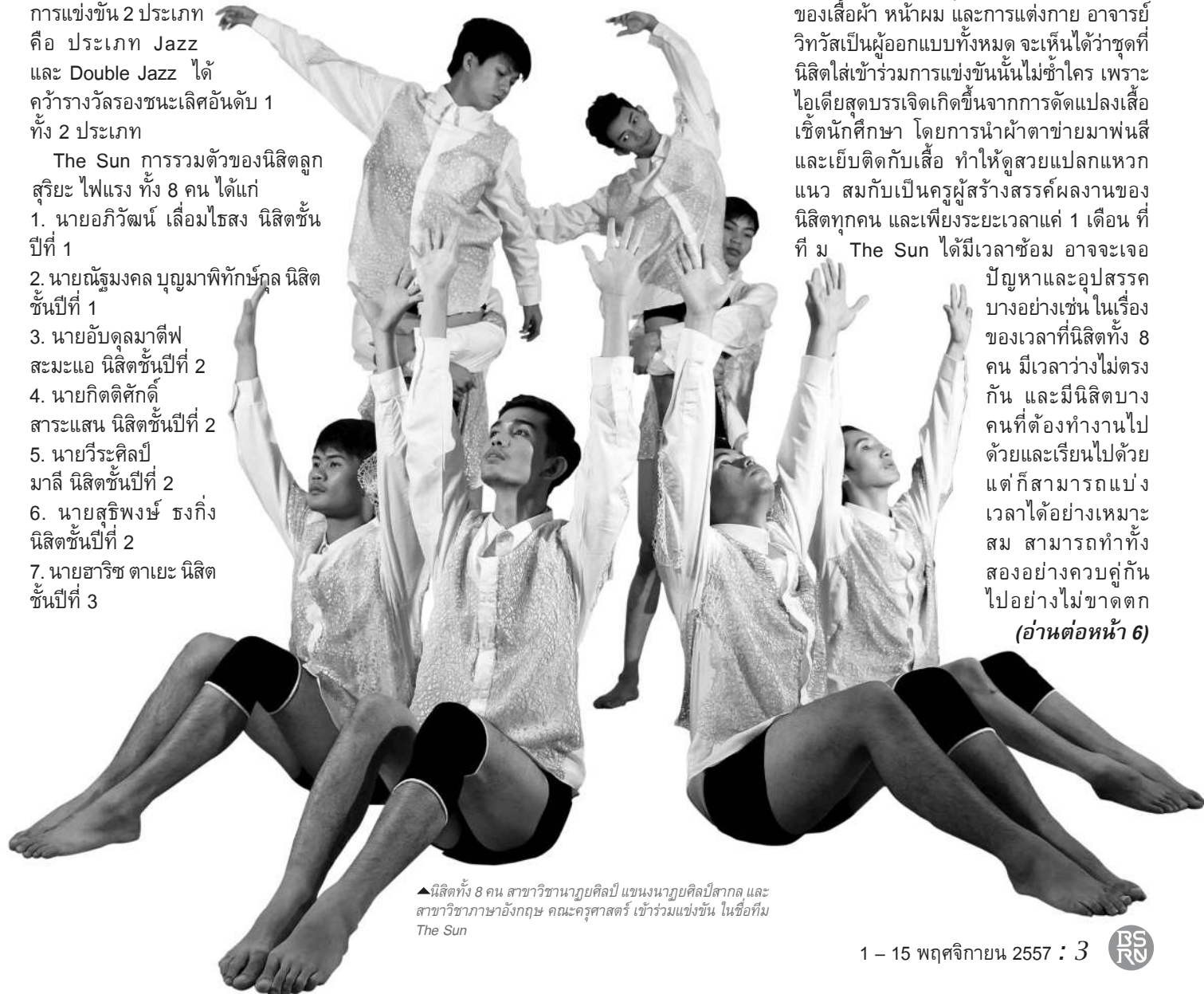
▲ นิสิตทั้ง 8 คน สาขาวิชานาฏยศิลป์ แขนงนาฏยศิลป์สากล และสาขาวิชาภาษาอังกฤษ คณะครุศาสตร์ เข้าร่วมแข่งขัน ในชื่อทีม The Sun

เจอปัญหาและอุปสรรคบางอย่างเช่น ในเรื่องของเวลาที่ นิสิตทั้ง 8 คน มีเวลาว่างไม่ตรงกัน และมี นิสิตบางคนที่ต้องทำงานไปด้วยและเรียนไปด้วย แต่ก็สามารถแบ่งเวลาได้อย่างเหมาะสม สามารถทำทั้งสองอย่างควบคู่กันไปอย่างไม่ขาดตก (อ่านต่อหน้า 6)